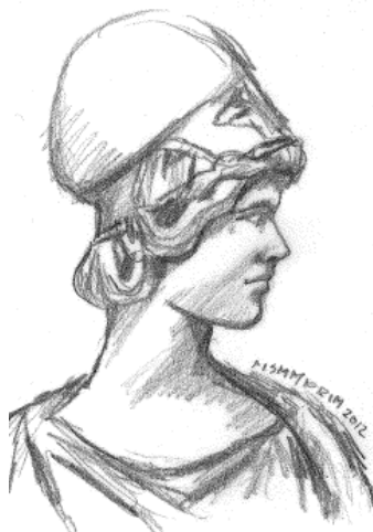
Athéna Dessin de Lise-Marie Piller