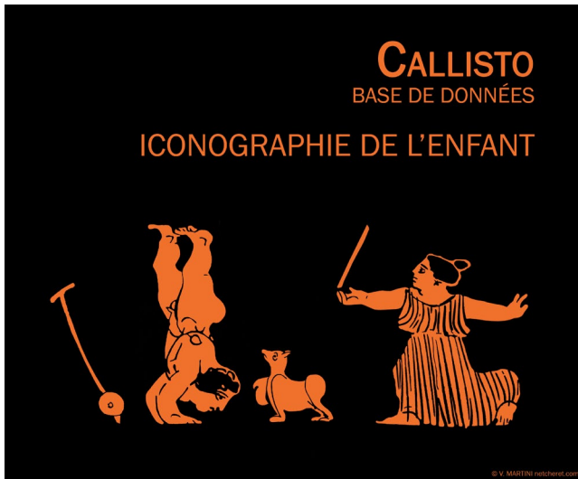
Choes attiques, fin Ve s. fin Ve s. av. J.-C. Dessin V. Martini

« The ancient skeptic roots of Husserlian epoche », in P. Varga, D. Zuh (eds.), Kortársunk, Husserl , Budapest, 2013, 143–166.